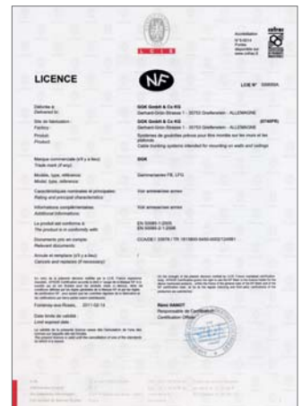
Zertifikat: NF (Cofrac)