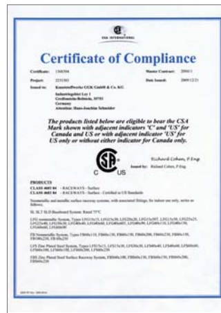
Zertifikat: CSA International