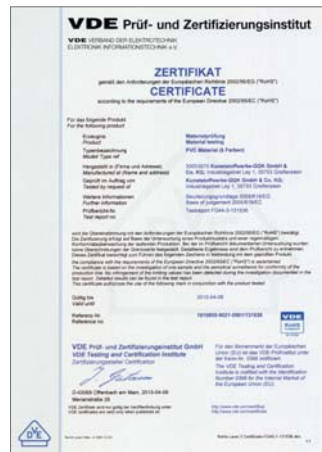
Zertifikat: RoHS (Materialprüfung)