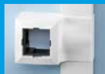
Modulbox MB domino für 1 M45 Einbaugerät***