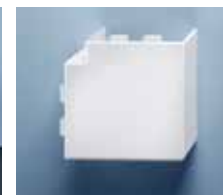
Flachwinkel 15 x 50