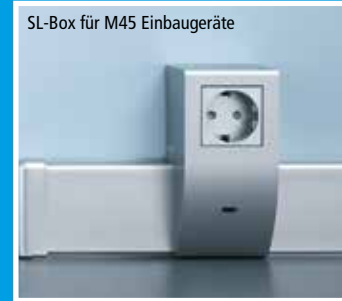
für 1 M45 Einbaugerät aus dem M45 Modulbaukasten geeignet